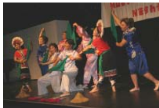
多元文化之夜 福爾摩沙舞蹈團表演