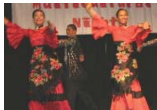
多元文化之夜 菲律賓Samahan舞蹈團表演