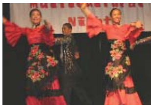
多元文化之夜 菲律賓Samahan舞蹈團表演