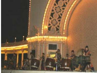
十鼓擊樂團於Balboa Park Spreckels Organ Pavilion表演

第八屆聖地牙哥台灣傳統週於五月十日至五月二十五日舉行。十日當天在停車場有美食園遊會，十幾個社團擺出拿手台灣菜，遊客們有如逛台灣美食街，大快朵頤。晚上七時開始的開幕式，由陳姿安小姐主持。典禮中頒獎「陳戴款紀念基金」模範母親予朱邱雪珠女士，亦頒發四位高中生獎學金，台灣旅遊獎，和茂均紀念基金(詳情請參閱內頁榮譽獎勵委員會報告)。壓軸是由何正泰醫師表演的布袋戲，他高超的技藝，布偶在他手中栩栩如生，加上幽默風趣的劇情和台詞，讓台下觀眾不時爆笑激賞。